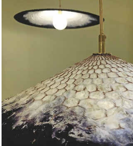
Leuchte 'Wireworks' von Atlas, eine filigrane Papier- und Drahtstruktur.