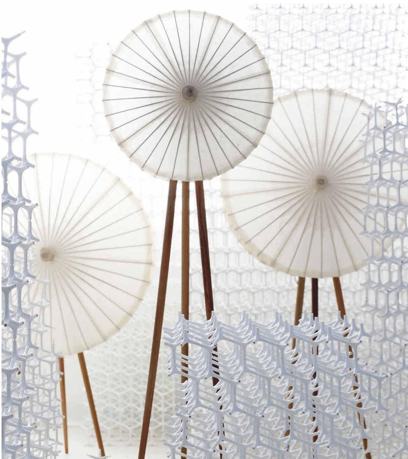
Moderne mischt sich mit Tradition: Installation 'Y Shape Furniture System' und 'Light of Bamboo', entworfen von Jamy Yang.