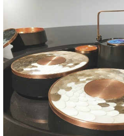
Keren Zhang bildet auf ihren Gefäßen und Teekannen das Gefieder des Eisvogels nach.