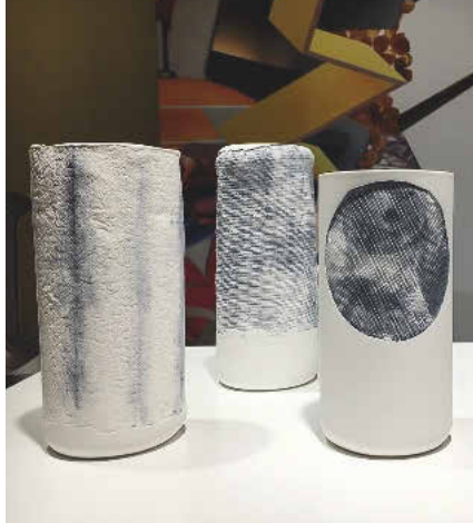
Keramikgefäße mit Strukturen traditioneller Textilien von Atelier Murmur.